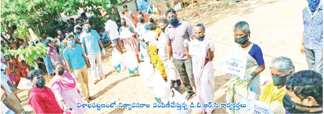
విశాఖపట్టణంలో నిత్యావసరాల పంపిణీచేస్తున్న డి.బి.ఆర్.సి.కార్యకర్తలు