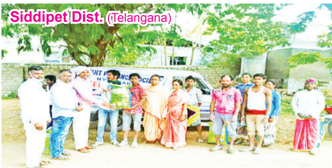
Siddipet Dist. (Telangana)