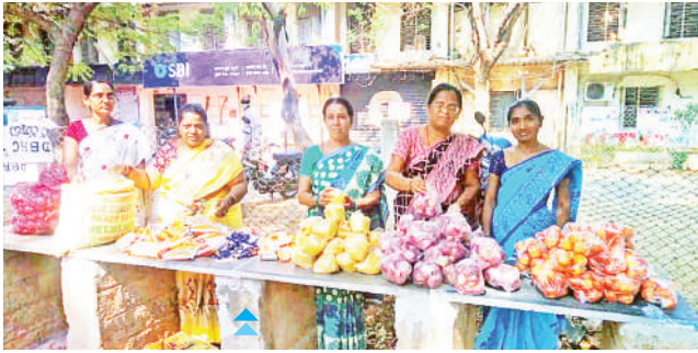
నిత్యావసరాల కిట్లను సిద్ధం చేస్తున్న డి.బి.ఆర్.సి.కర్నూలు టీం