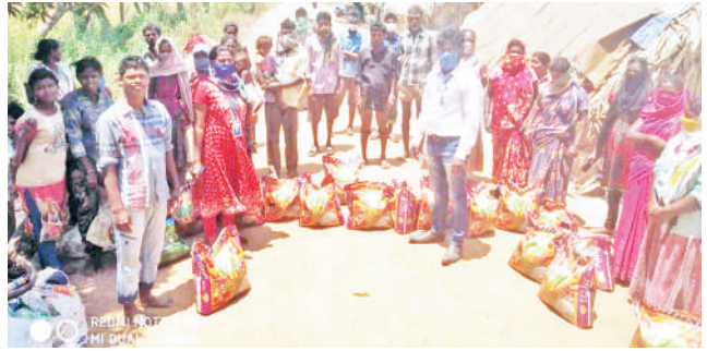
పోరంకిలోని వేస్తు పిక్లర్లకు నిత్యావసరాల పంపిణీ