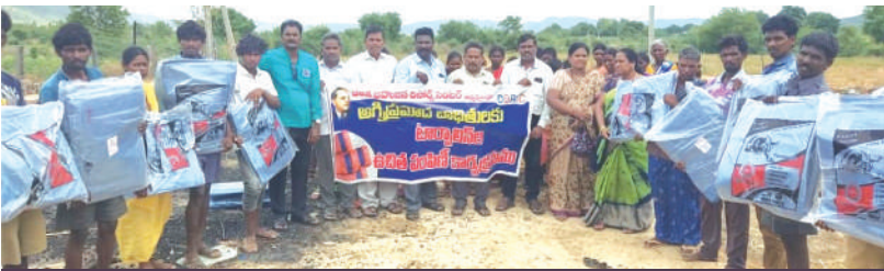
అగ్ని ప్రమాదం..ఇళ్ళు కోల్పోయిన చెంచులు