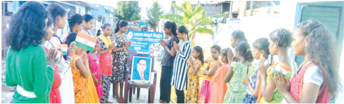
అంబేద్కర్ జయంతి కార్యక్రమం నిర్వహిస్తున్న బాలల విజ్ఞాన కేంద్రంలోని బాలలు, ఏలూరు