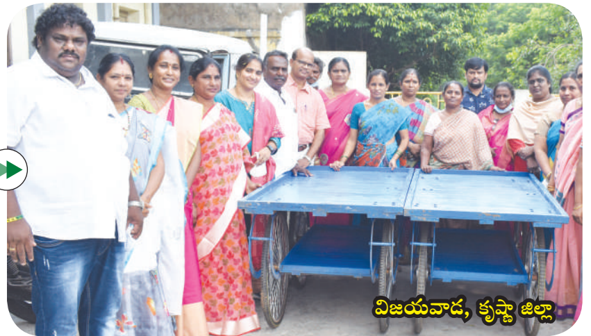
విజయవాడ, కృష్ణా జిల్లా