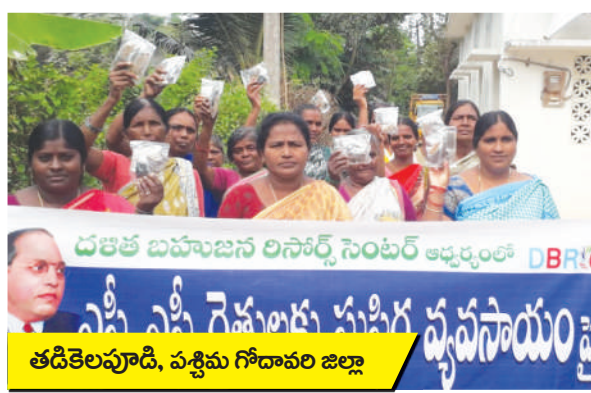
తడికెలపూడి, పశ్చిమ గోదావరి జిల్లా