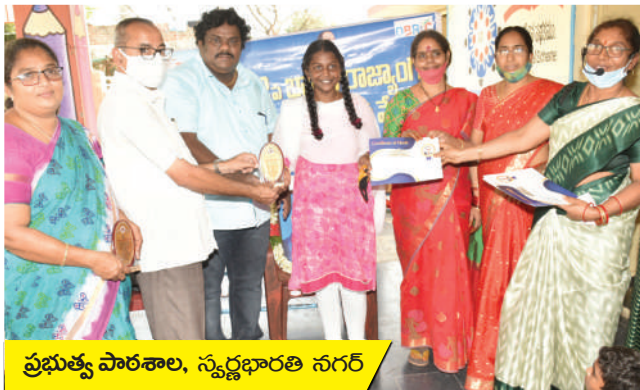
ప్రభుత్వ పాఠశాల, స్వర్ణభారతి నగర్