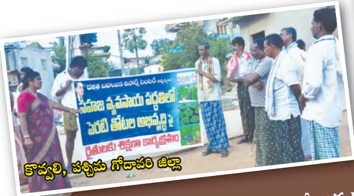
కొవ్వలి, పశ్చిమ గోదావరి జిల్లా