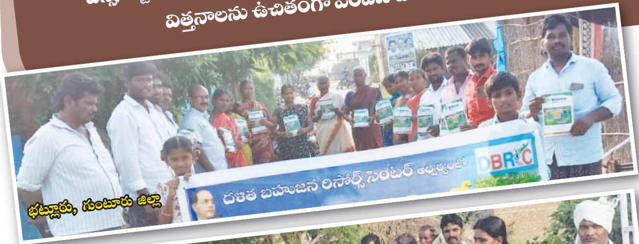
భట్లూరు, గుంటూరు జిల్లా

పెరటి తోటలను ప్రోత్సహించే కార్యక్రమంలో భాగంగా డిబిఆర్ సి పని ప్రాంతాలలో ఎస్సీ, ఎస్టీ కుటుంబాలకు దాదాపు 1300 మందికి 11 రకాల కూరగాయల విత్తనాలను ఉచితంగా పంపిణీ చేయడం జరిగింది.