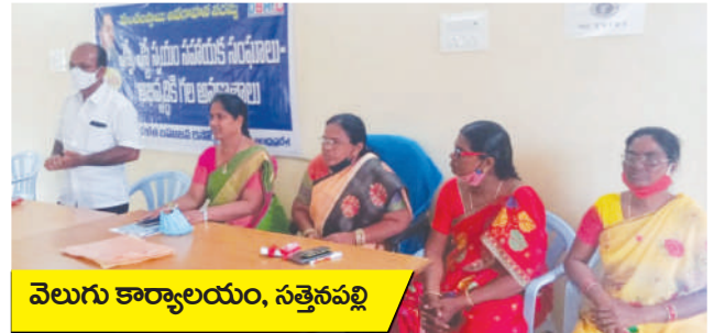
వెలుగు కార్యాలయం, సత్తెనపల్లి

మండల స్థాయి అధికారులు కార్యక్రమాలలో పాల్గొన్న స్వయం సహాయక సంఘాల ప్రతినిధులు మరియు సభ్యులకు ప్రభుత్వం ఎస్ హెచ్ జిల ద్వారా స్త్రీ నిధి, ఉన్నతి మరియు బ్యాంక్ లింకేజీల ద్వారా అందిస్తున్న వివిధ సంక్షేమ పథకాలను గూర్చి పూర్తిస్థాయి అవగాహన కల్పించడంతో పాటు సభ్యులు ఎదుర్కొంటున్న సమస్యల్ని అడిగి తెలుసుకుని వారి సందేహాలను నివృత్తి చేయడం జరిగింది. సంఘంలోని సభ్యులు ఆర్థికాభివృద్ధి సాధించాలనే ఉద్దేశ్యంతో ప్రభుత్వం అందిస్తున్న రుణాలను సద్వినియోగం చేసుకుని జీవన ప్రమాణాల్ని పెంపొందించుకోవాలని సూచించడం జరిగింది. కిచెన్ గార్డెన్ల ఏర్పాటు, కోడి పిల్లల పెంపకంతో ఇంటివద్దనే ఆదాయ మార్గాలను