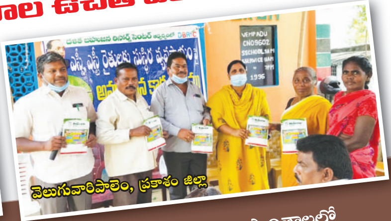
వెలుగువారిపాలెం, ప్రకాశం జిల్లా

పెరటి తోటలను ప్రోత్సహించే కార్యక్రమంలో భాగంగా డిబిఆర్ సి పని ప్రాంతాలలో ఎస్సీ, ఎస్టీ కుటుంబాలకు దాదాపు 1300 మందికి 11 రకాల కూరగాయల విత్తనాలను ఉచితంగా పంపిణీ చేయడం జరిగింది.