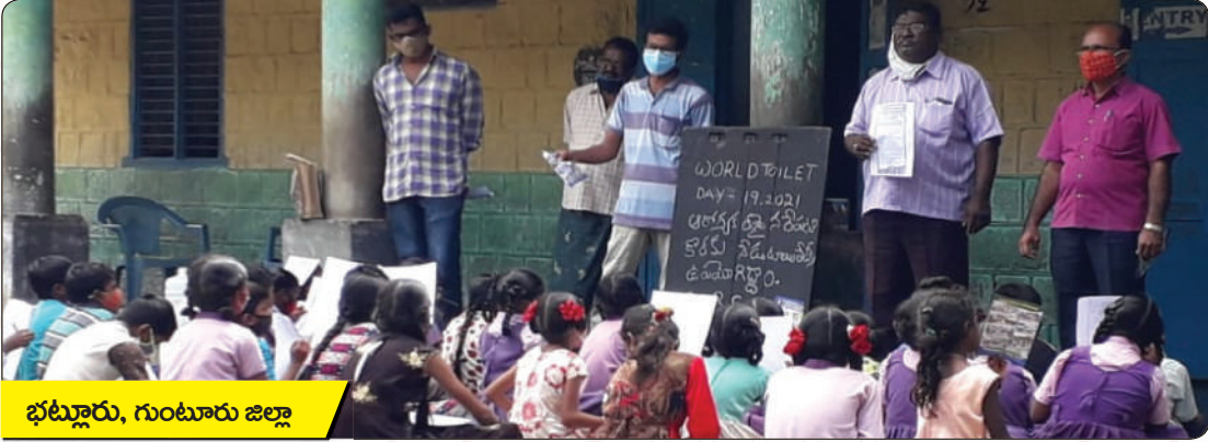
భట్లూరు, గుంటూరు జిల్లా