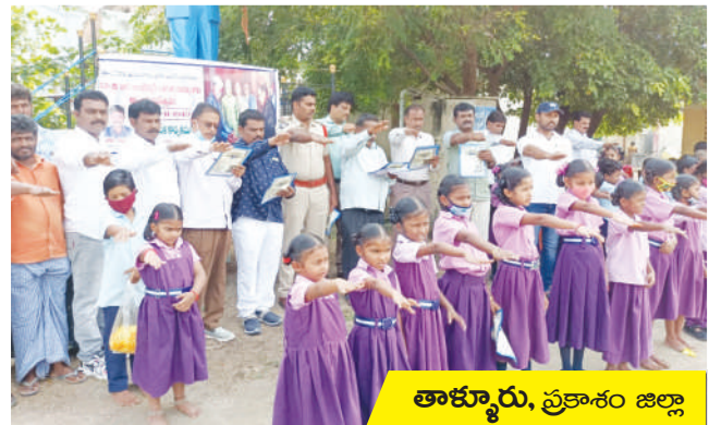
తాళ్ళూరు, ప్రకాశం జిల్లా