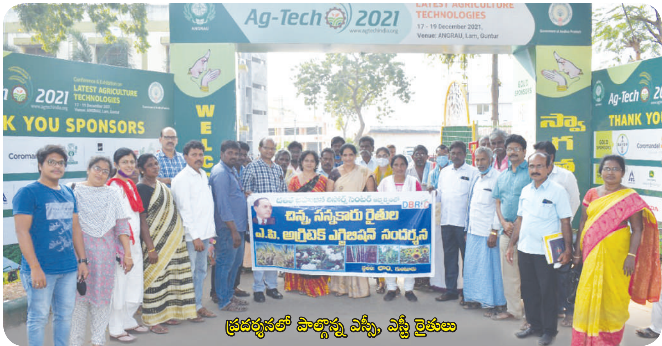
ప్రదర్శనలో పాల్గొన్న ఎస్సీ, ఎస్టీ రైతులు

ఈ విజ్ఞాన సదస్సుకు డిబిఆర్సి ప్రతినిధులు, గుంటూరు, ప్రకాశం, పశ్చిమగోదావరి జిల్లాల నుండి 31 మంది ఎస్సీ, ఎస్టీ రైతులు పాల్గొనడం జరిగింది. *