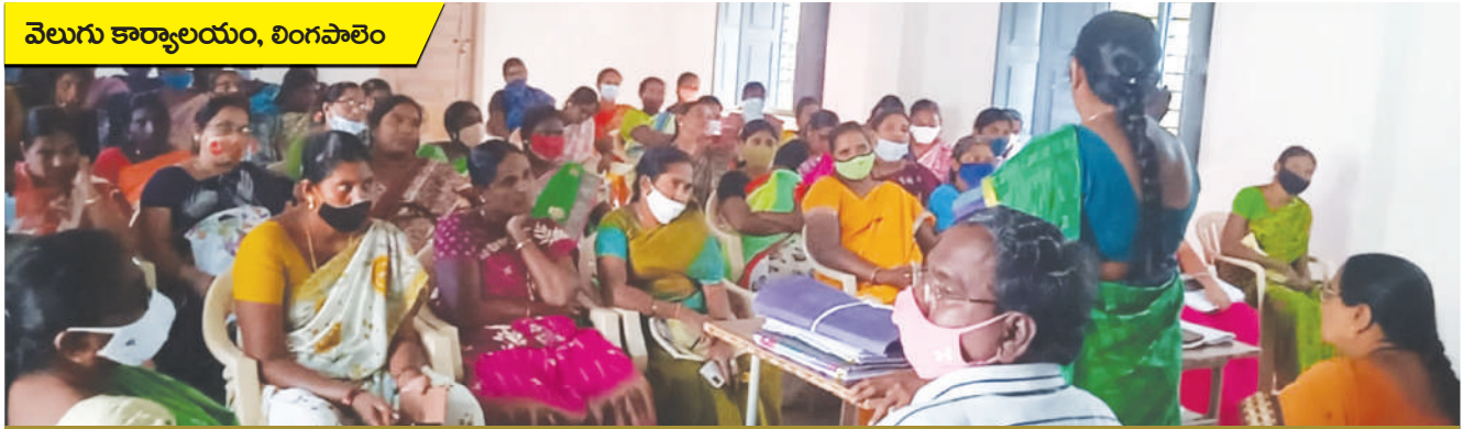
వెలుగు కార్యాలయం, లింగపాలెం