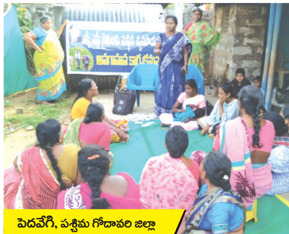
పెదవేగి, పశ్చిమ గోదావరి జిల్లా

గుంటూరు, పశ్చిమ గోదావరి, ప్రకాశం జిల్లాలలో డిజిఆర్ సి జిల్లా కో-ఆర్డినేటర్లు మరియు కమ్యూనిటీ మొబిలైజర్ల ఆధ్వర్యంలో నిర్వహించిన ఈ అవగాహన కార్యక్రమాలలో స్థానిక మండల, గ్రామస్థాయి వ్యవసాయ శాఖ అధికారులు పాల్గొని దాదాపు 17 మండలాల్లోని 1000 మంది ఎస్సీ ఎస్టీ రైతులకు ప్రకృతి వ్యవసాయంపై అవగాహన కల్పించడం జరిగింది. *