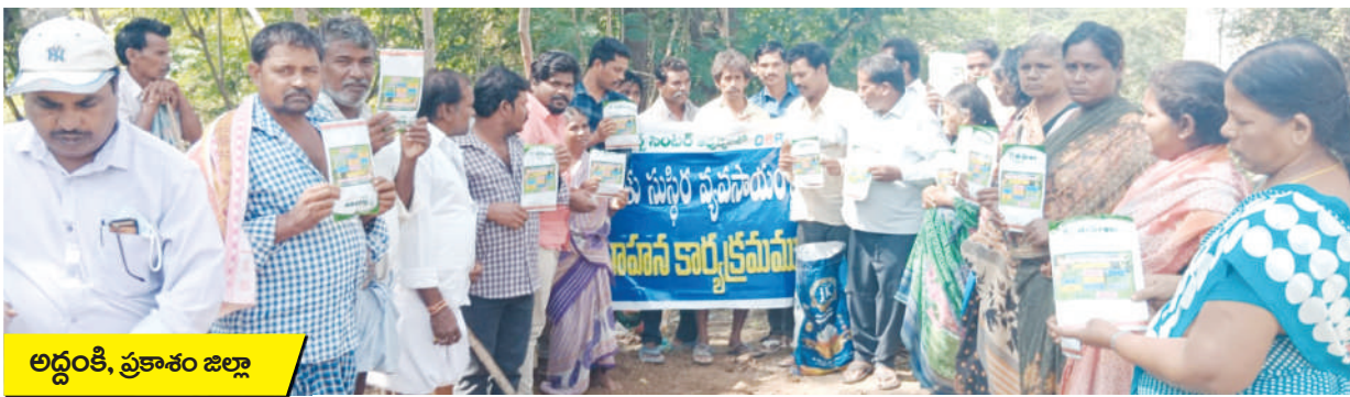
అద్దంకి, ప్రకాశం జిల్లా