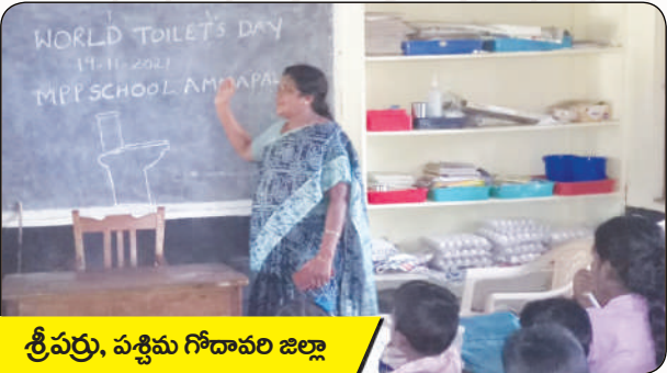
శ్రీపర్తి, పశ్చిమ గోదావరి జిల్లా