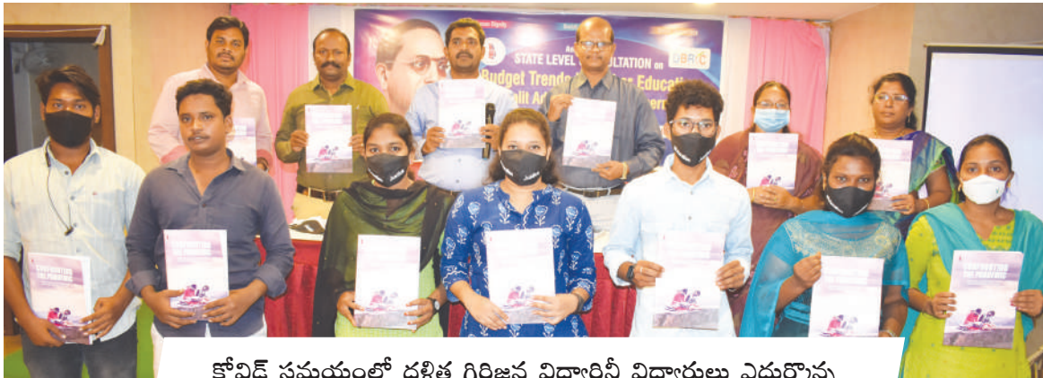
కోవిడ్ సమయంలో దళిత గిరిజన విద్యార్థిని విద్యార్థులు ఎదుర్కొన్న సవాళ్ళపై జాతీయ స్థాయిలో నిర్వహించిన అధ్యయన నివేదిక ఆవిష్కరణ