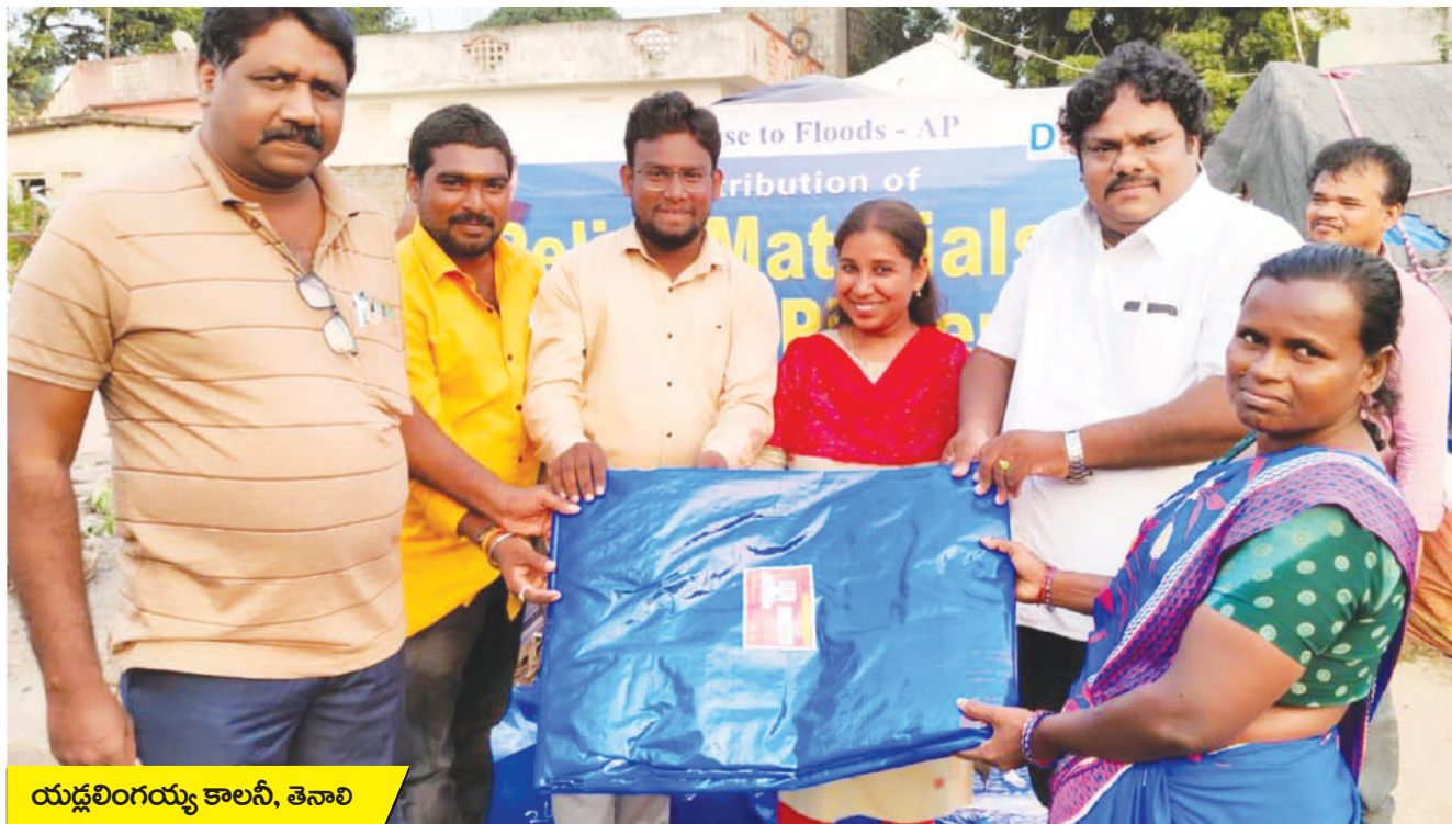
యడ్లలింగయ్య కాలనీ, తెనాలి