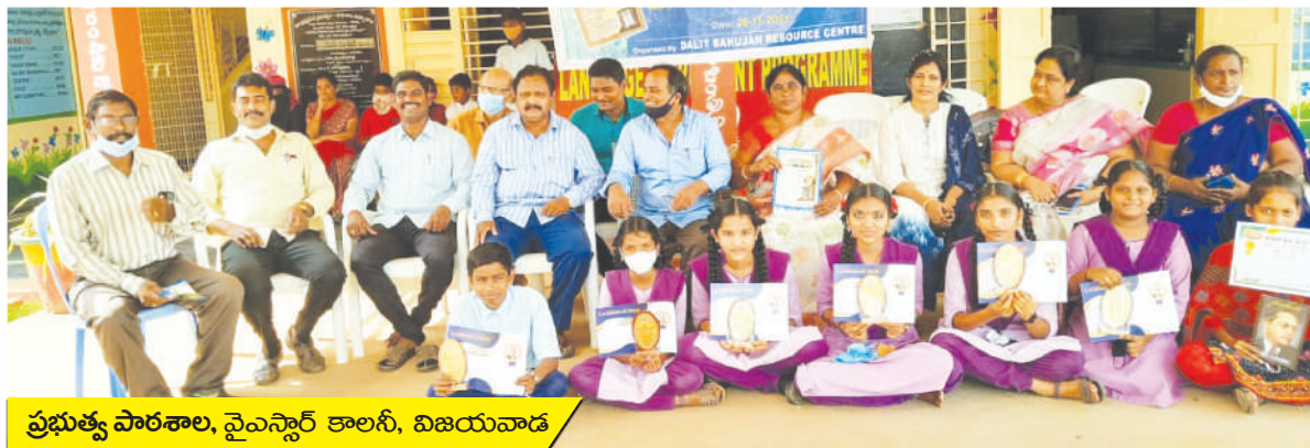
ప్రభుత్వ పాఠశాల, వైఎస్సార్ కాలనీ, విజయవాడ