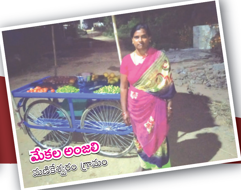
మేకల అంజలి మణికేశ్వరం గ్రామం