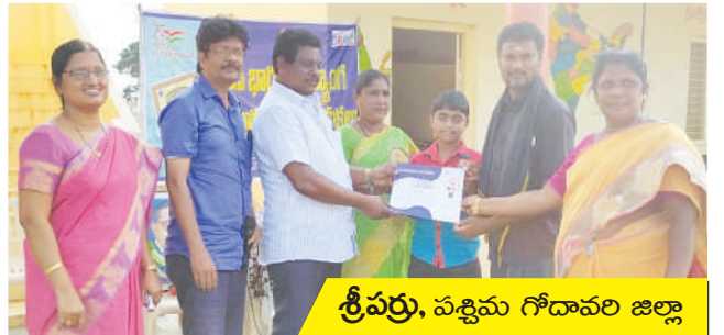
శ్రీవర్ధు, పశ్చిమ గోదావరి జిల్లా