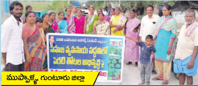
ముప్పాళ్ళ, గుంటూరు జిల్లా