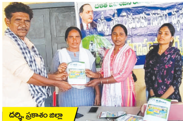
దర్శి, ప్రకాశం జిల్లా