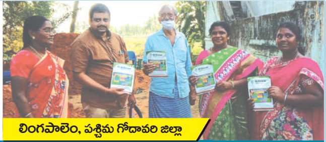
లింగవాలెం, పశ్చిమ గోదావరి జిల్లా