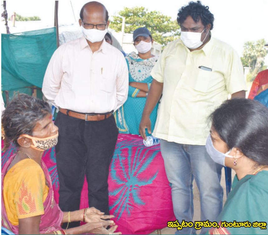
ఇప్పటంగ్రామం, గుంటూరు జిల్లా