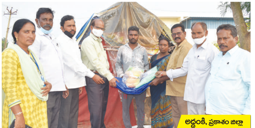
అద్దంకి, ప్రకాశం జిల్లా