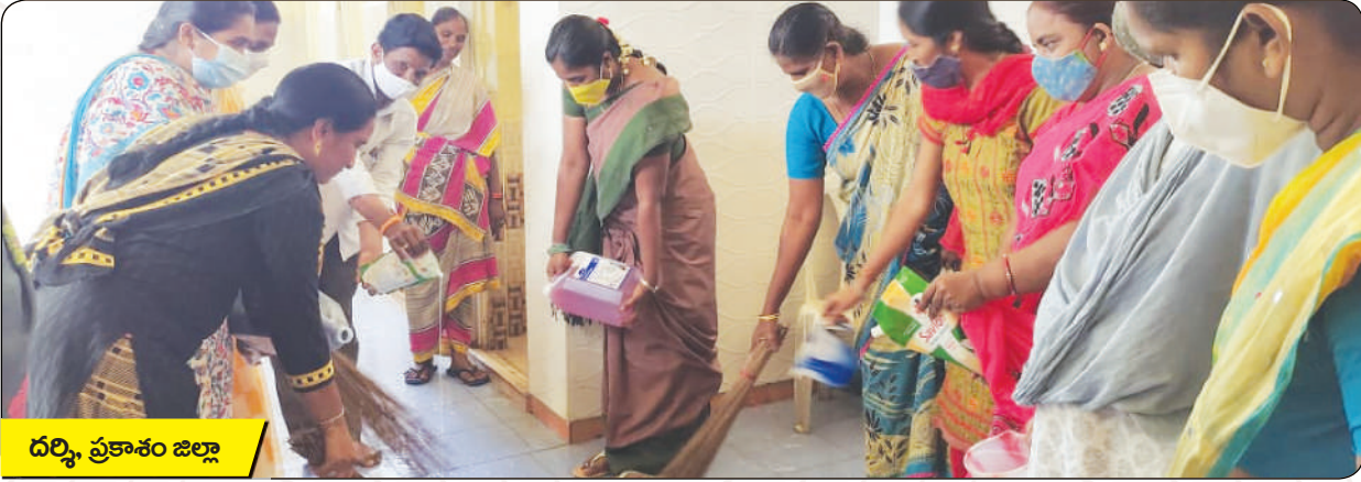
దర్శి, ప్రకాశం జిల్లా