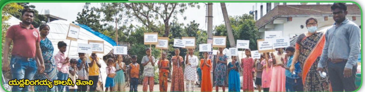
యద్దలింగయ్య కాలనీ, తెనాలి

వారోత్సవాల్లో పాల్గొన్న పిల్లలందరికీ ఆటల పోటీలు నిర్వహించి బహుమతులు అందజేయడం జరిగింది. సిటీ కో-ఆర్డినేటర్లు, కమ్యూనిటీ మొబిలైజర్ల ఆధ్వర్యంలో నిర్వహించబడిన ఈ వారోత్సవాల్లో గుంటూరు, కృష్ణా, పశ్చిమ గోదావరి, ప్రకాశం జిల్లాల్లోని 35 ప్రాంతాల్లోని దాదాపు 2500 మంది పిల్లలు, పెద్దలు పాల్గొన్నారు. వారం రోజులపాటు నిర్వహించిన ఈ వారోత్సవాలలో పిల్లలు-పెద్దలు ఎంతో ఉత్సాహంగా పాల్గొన్నారు.