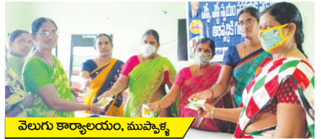
వెలుగు కార్యాలయం, ముప్పాళ్ళ

ఏర్పాటుచేసుకోవాలని తెలియజేయడం జరిగింది. చిరు వ్యాపారులు, వ్యవసాయ కూలీలు అందరూ ఈ-శ్రమ నమోదు చేయించుకోవడం ద్వారా ప్రమాదాలు జరిగినపుడు ప్రభుత్వం నుండి ఆర్థిక సాయం లభిస్తుందని వివరించడం జరిగింది. గ్రామ స్థాయిలో గతంలో ప్రభుత్వం పంపిణీ చేసిన ఇళ్ళకు గాను “వన్ టైమ్ సెటిల్ మెంట్” పేరుతో రిజిస్ట్రేషన్ పనులను ప్రభుత్వం ప్రారంభించినట్లు తెలియజేసి సహకార సంఘాల ద్వారా సమాచారాన్ని ప్రతి ఒక్కరికీ చేరవేయాలని సూచించడం జరిగింది.