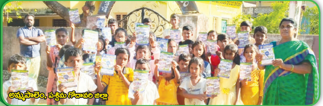
అమ్మపాలెం, పశ్చిమ గోదావరి జిల్లా