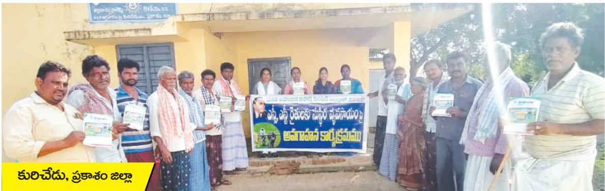
కురిచేడు, ప్రకాశం జిల్లా

అంతేకాక తక్కువ ఖర్చుతో సహజ ఎరువులతో తయారు చేసుకోగలిగే జీవామ్లతం, కషాయాలు, ఆవుమూత్రం,