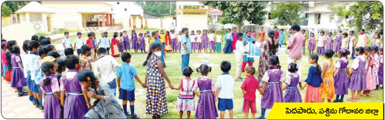
పెదపాడు, పశ్చిమ గోదావరి జిల్లా

అంతర్జాతీయ హ్యాండ్‌వాష్ డే సందర్భంగా డిబిఆర్‌సి ఆధ్వర్యంలో గుంటూరు, కృష్ణా, ప్రకాశం, పశ్చిమ గోదావరి జిల్లాల్లో సుమారు 1000 మంది పిల్లలకు అవగాహన కల్పించడం జరిగింది.