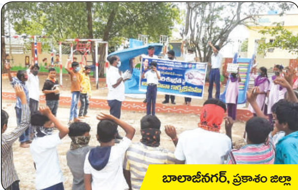
బాలాజీనగర్, ప్రకాశం జిల్లా