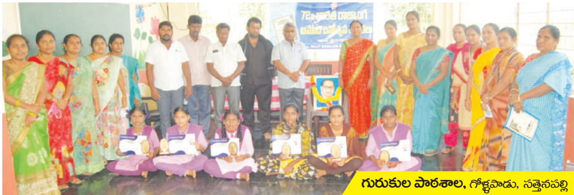
గురుకుల పాఠశాల, గోళ్ళపాడు, సత్తెనపల్లి