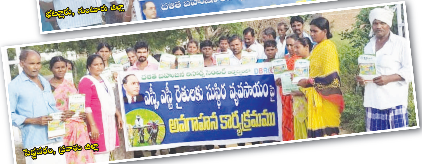
పెద్దవరం, ప్రకాశం జిల్లా