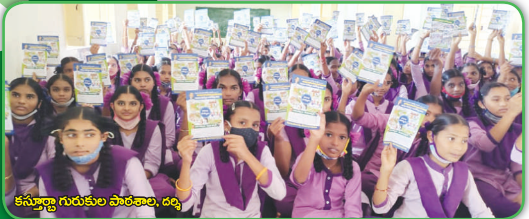
కస్తూర్బా గురుకుల పాఠశాల, దర్శి