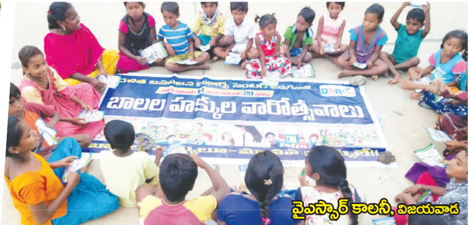
వైఎస్సార్ కాలనీ, విజయవాడ