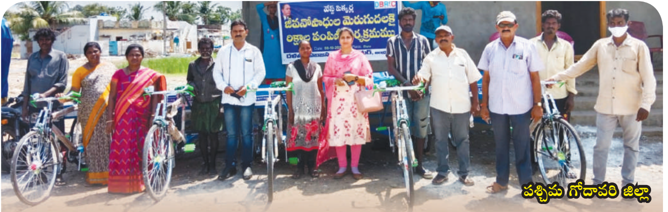
పశ్చిమ గోదావరి జిల్లా