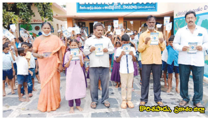
కొరికపాడు, ప్రకాశం జిల్లా

మొదలైన అంశాలపై కరపత్రాల పంపిణీ, నినాదాలు చెప్పించడం, స్పూర్తి కథలను వివరించడం ద్వారా అవగాహన కల్పించడం జరిగింది.